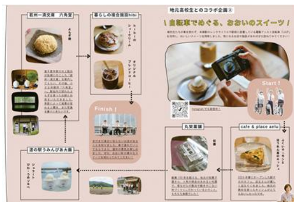
移住定住カルチャー誌「Oh! Time」 https://www.town.ohi.fukui.jp/newijuteiju/news/p24113.html