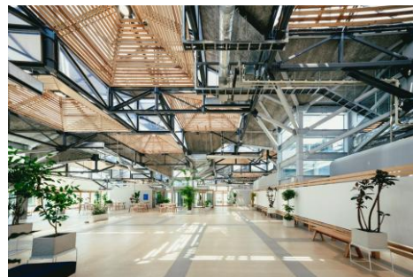
複合商業施設「SEE SEA PARK」( https://see-sea.co.jp/ )