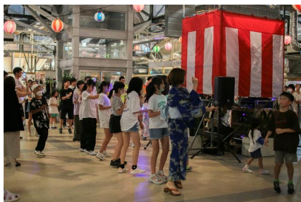
Re:盆プロジェクト 納涼祭