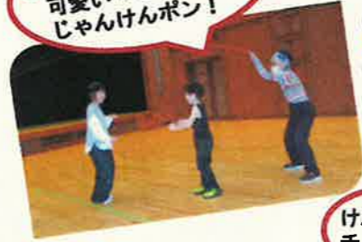
けん玉 チャレンジ