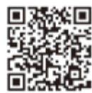
里親支援センター 福さと