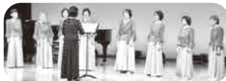
←町民文化祭での歌唱