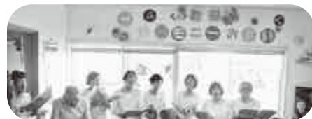
↑びわの木での歌唱