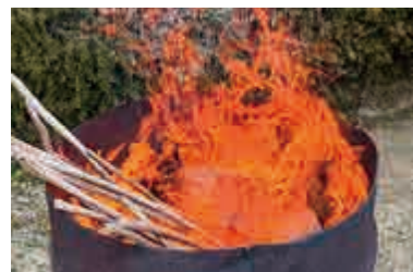
たき火に該当すると考えられる行為（イメージ）