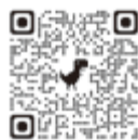
法務省 住所等変更登記 の義務化