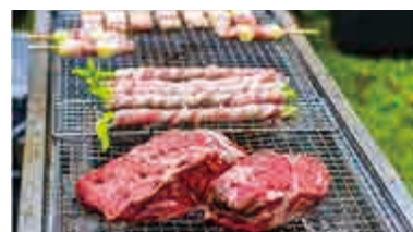
たき火に該当しないと考えられる行為（イメージ）