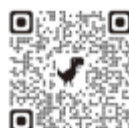
おい町 生活安定資金等融資 制度のご案内

町内に1年以上住所を有し、融資金の返還能力を有する個人（事業資金は対象外） ※詳しくは、取扱金融機関へお問い合わせください。