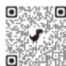
進学サポート 給付金