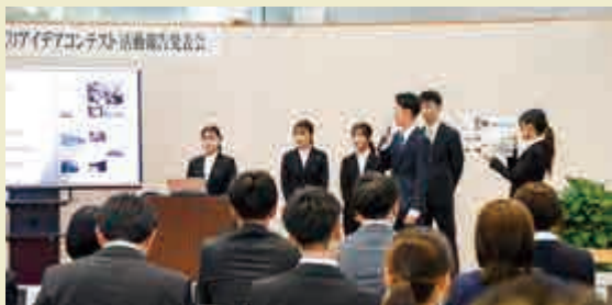
◆ 活動報告発表会（令和7年11月29日）

昨年度の「まちづくりアイデアコンテスト」で入賞した4つの学生チームが、今年度、アイデアの実行に取り組みました。今月の地域おこし散歩では、学生たちが地域の方々と協働しながら歩んだ一年間の活動の軌跡を紹介します。