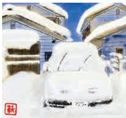
NPO法人森林楽校・森んこ 代表 萩原茂男

そうと知っても、やっぱり、グツと冷え込んだん朝は、10センチ以上積もっていませんようにと、祈るようにカーテンを開けるのです。