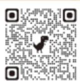
おおい町議会だより バックナンバー

結びに、新しい年が、町民の皆さまにとりまして幸せで実り多い年でありますよう、議員一同心よりご祈念申し上げます。新年のご挨拶いたします。