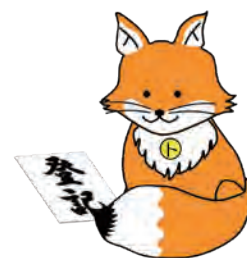
不動産登記推進 イメージキャラクター 「トウキツネ」

令和6年4月1日から相続登記が義務化され、相続（遺言を含む）によって不動産を取得した相続人は、その所有権を取得したことを知った日から3年以内に相続登記の申請をしなければならないこととされました。また、正当な理由がないのに、不動産の相続を知ってから3年以内に相続登記の申請をしないと、10万円以下の過料が科される可能性があります。相続人申告登記（相続登記より簡易に義務を履行できる、無料の手続）を行うことで、過料が科されなくなります。