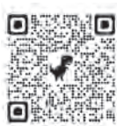
おおい町 ホームページ