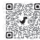
法務省 ホームページ