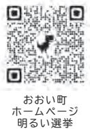
おい町 ホームページ 明るい選挙