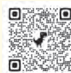
おおい町役場 防災Twitter