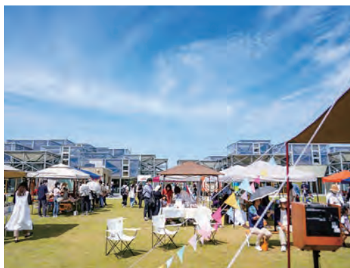
◆「おおい Craft Garden」のイベント風景

事務局だけでなく、町の住民や出店者の皆さんも企画者となり、町と一緒に盛り上げる流れがシーシーパークでは生まれてきています。それは、すごく素敵なことだと思っています。