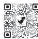
おい町 ホームページ