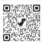
おおい町役場 フェイスブック