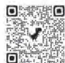
ふくい桜マラソン ランナー募集

※2 RUNNET（ランネット）によるウェブエントリー。 エントリーにはRUNNETへの会員登録（無料）が必要です。