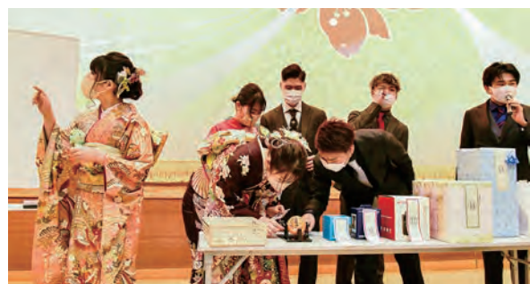
【令和5年アトラクションの様子】