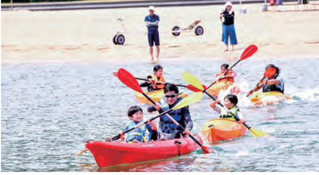
『マリンスポーツ体験教室』が開催されました。参加者たちは、カヌーやSUP、アクアチューブ、ウォーターボールなど海のアクティビティを満喫しました。(6月25日(日) 長井浜海水浴場)