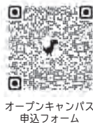
オープンキャンパス 申込フォーム

※ 資料等の準備の都合上、 事前に申し込みください。 詳しくは公立若狭高等看護学院 までお問合せください。