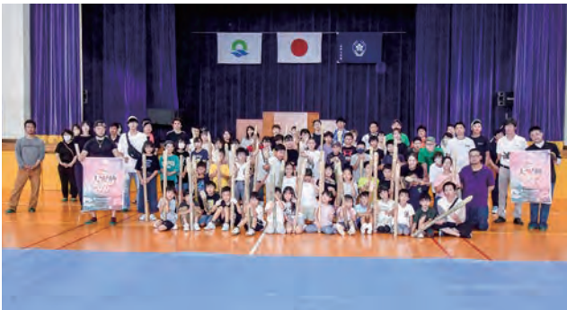
スーパー大火勢実行委員協力のもと、『親子松明づくり』が行われました。親子で協力して完成させた松明は、9月9日に開催予定の「スーパー大火勢」の松明行列で使われます。(7月1日(土) 本郷小学校)