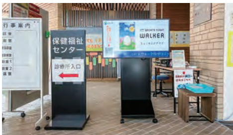
【保健福祉センターなごみ】