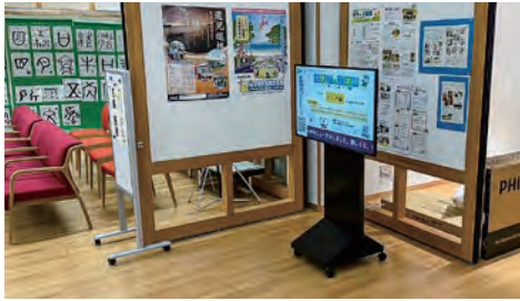
【里山文化交流センター】

「レッツウォーク15+」のリニューアルに伴い、町内4施設にデジタルサイネージを設置しました。