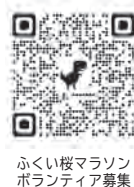
ふくい桜マラソン ボランティア募集