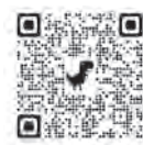
各法務局の案内は コチラ

A. 全国の法務局では、 手続案内 を行っています。（ 予約制 ）また、法務局ホームページで手続や書式をご案内しています。