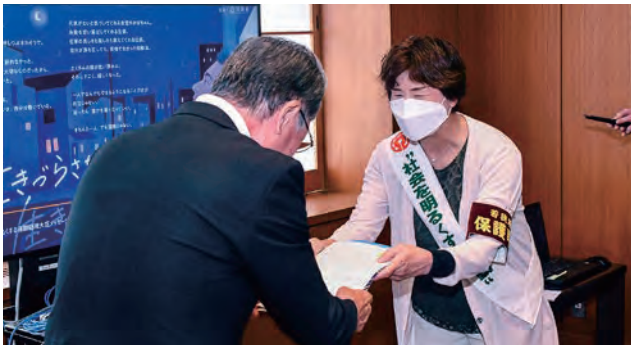
7月1日からの『社会を明るくする運動』強化月間に向けて、若狭地区保護司会大飯支部より内閣総理大臣メッセージが伝達されました。(6月29日(木) おおい町役場)