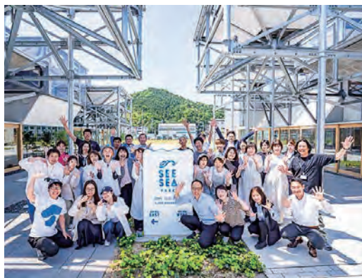
◆ 事務局メンバーと出店者の集合写真

どうしても大変なことが多々あります。でも、仲間たちと「ああでもない」「こうでもない」と言いながら夢中になっているのはやっぱり楽しい。そうして、自分が仲間たちと一緒に楽しむことで、町の若い子たちが「あのおっちゃんら、なんか楽しそうだな」と感じてくれたらいいですね。