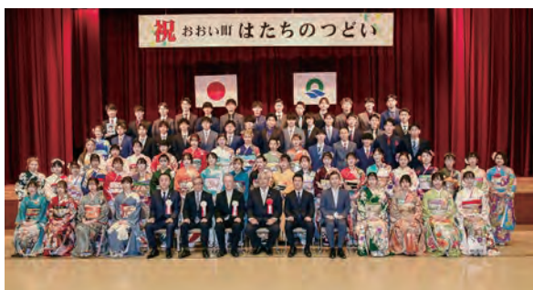
【令和5年はたちのつどいの様子】

おい町教育委員会事務局社会教育課へ電話でお申し込みください。（☎77-1150）