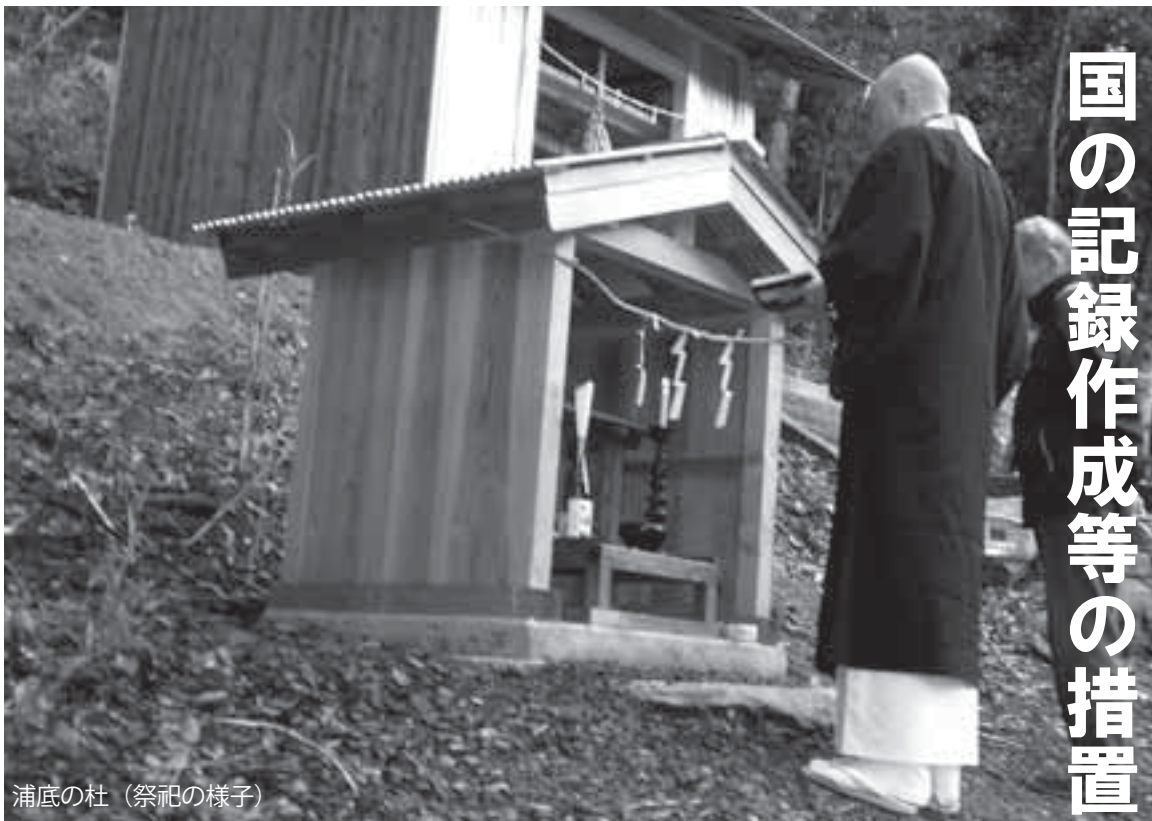
浦底の杜（祭祀の様子）

近年では、生業や社会構造の変化などによって、32カ所のうち10カ所前後で祭祀が行われるのみになっていますが、大島半島の一地域にのみ伝承される特徴的な信仰形態であり、貴重な民俗文化財です。