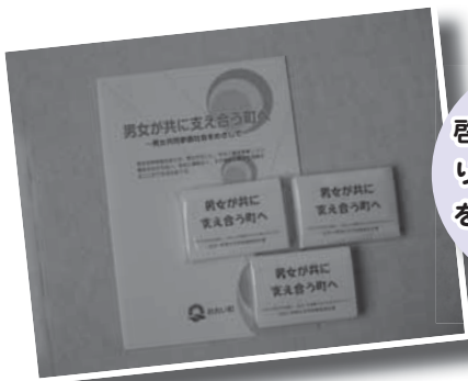
啓発グッズを配り男女共同参画をPRしました