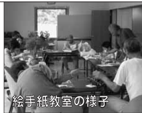
絵手紙教室の様子