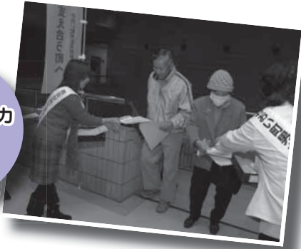
アンケート協力への呼びかけ