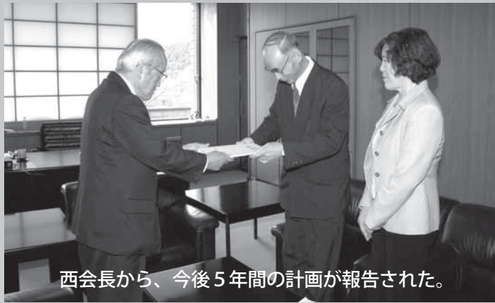
西会長から、今後5年間の計画が報告された。