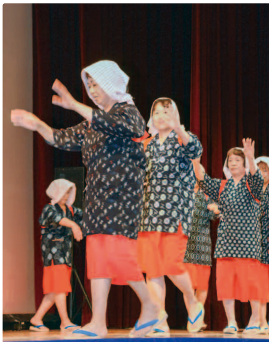
△大島踊り（平成 25 年 10 月 6 日 福井県市町文教選抜芸能祭）