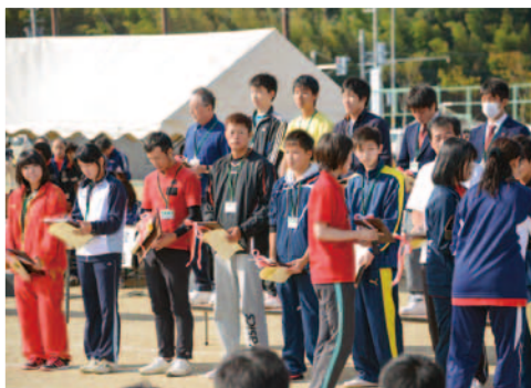
▲体育協会表彰 表彰式の様子

選手たちは、区民の声援を受け元気いっぱい競技に参加。会場にはさわやかな笑顔があふれました。 (10月13日 総合運動公園 多目的グラウンド)