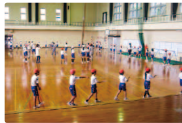
△大島小学校の児童が大島踊りを練習する様子