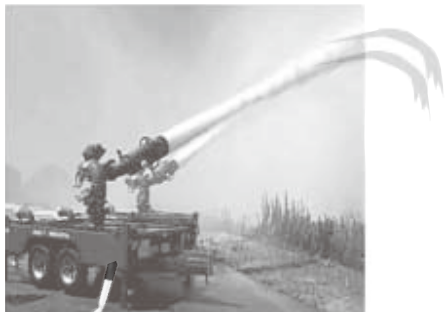
【放水砲イメージ図】

大飯発電所では、7月18日までに施行される原子力規制委員会の新しい安全基準に対応するため、航空機落下等の事故が発生した場合の対応策として、燃料火災にも対応が可能な放水砲と、敷地外への放射性物質の放出を抑制するシルトフェンスを6月末までに整備します。