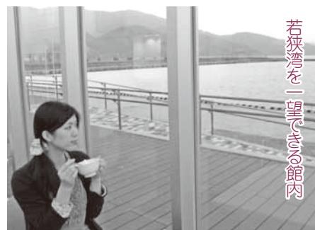
若狭湾を一望できる館内