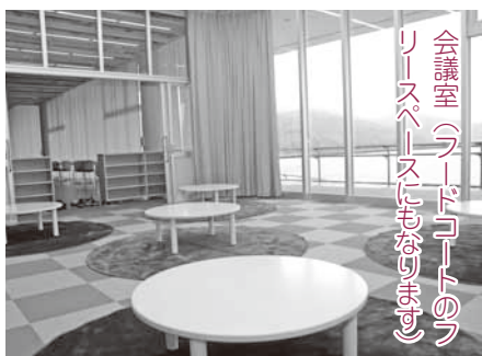
会議室（フードコートのフリースペースにもなります）