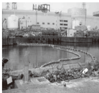
【シルトフェンスイメージ図】

(説明) 海洋への汚染水拡散防止のため、フロートから水中全体にカーテンが広がるように設置できる。