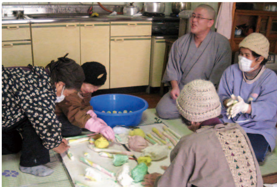
△涅槃団子を作る様子（平成 25 年 3 月 15 日）