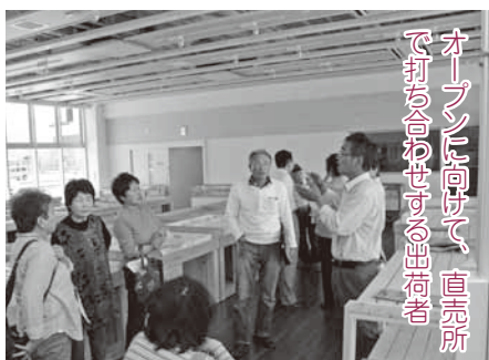
オープンに向けて、直売所で打ち合わせする出荷者