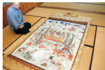
△実相寺の涅槃図（文正 12 年）

最近では涅槃会への参拝も少なくなってきたり、涅槃団子を作るところも少なくなってきたりしているそうです。