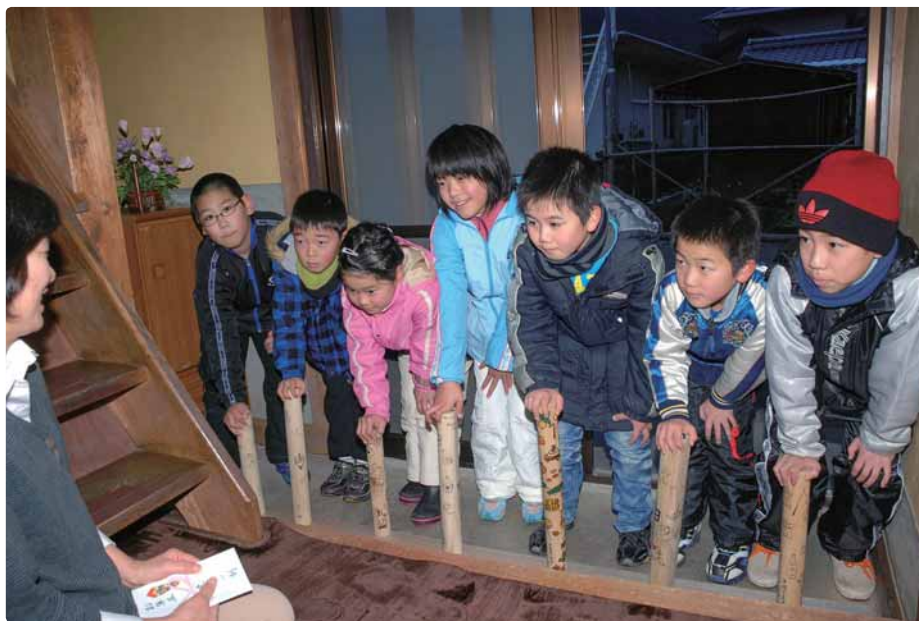
△戸祝いの様子（平成25年1月13日）