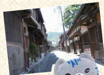
さばトラ ななちゃん