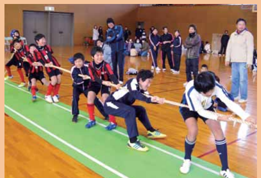
「第7回町民綱引き大会」 (2月10日 総合運動公園 体育館)