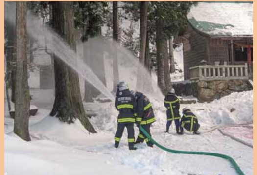
「文化財防御訓練」 (1月19日 苅田比売神社)