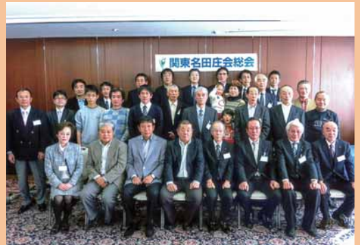
「第24回関東名田庄会総会」 (1月19日 東京都台東区)