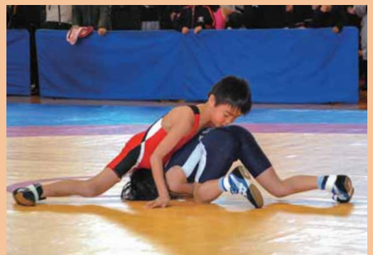
「第2回福井テレビ杯福井県レスリング選手権大会」 (2月3日 総合運動公園 体育館)