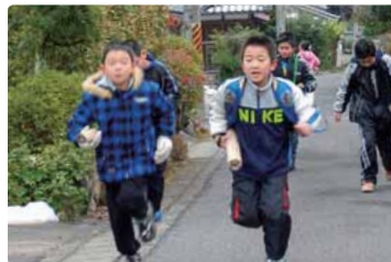
△キツネがえりの様子