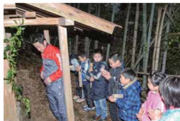
△山の神から福を受け取る七福神

訪れた家々で、「福入れましょー」「まーずめでたい戸祝う」と唱えながら、めでたい絵などが描かれた棒で地面をトントン打ち鳴らし、山の神の福を分け与え、家の方からねぎらいのお年玉を受け取ります。