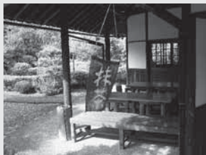
六角堂(ろっかくどう)

おいしいコーヒーや、よもぎもち、そばなどが味わえる喫茶・休憩所。よもぎは敷地内でとれたものを使用しています。