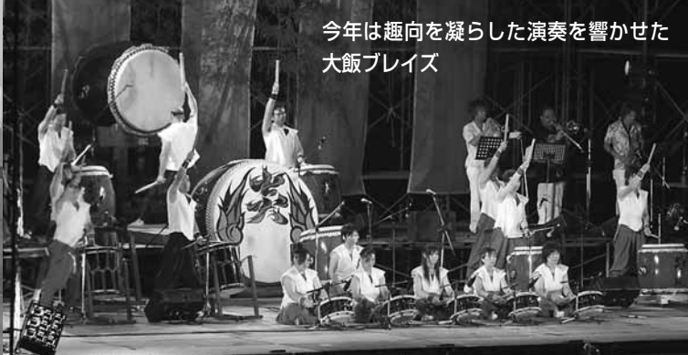
今年は趣向を凝らした演奏を響かせた 大飯ブレイズ