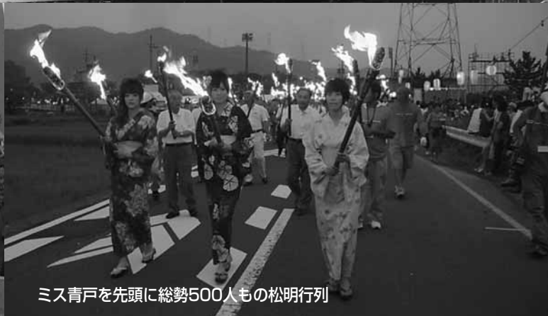
ミス青戸を先頭に総勢500人の松明行列