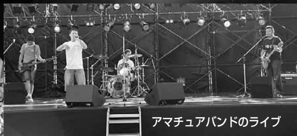
アマチュアバンドのライブ