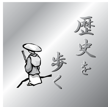
おおい町文化財巡り～その3～