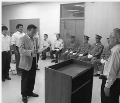
代表して謝辞を述べる屋敷さん