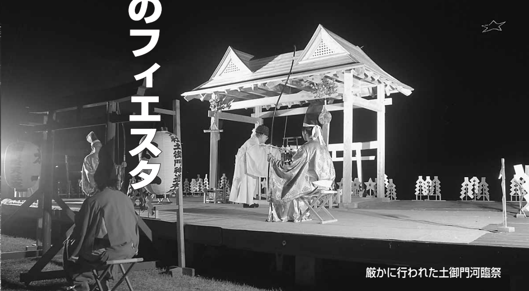
蔵かに行われた土御門河臨祭