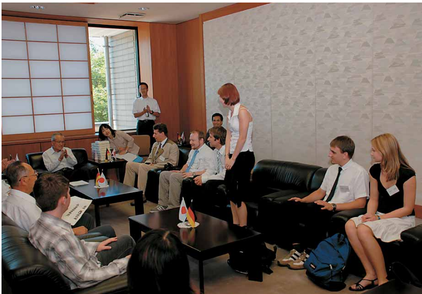
日本語で自己紹介をしてくれた