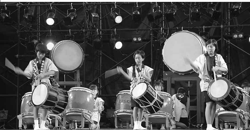
子ども太鼓の「小粋連」も迫力ある演奏だった