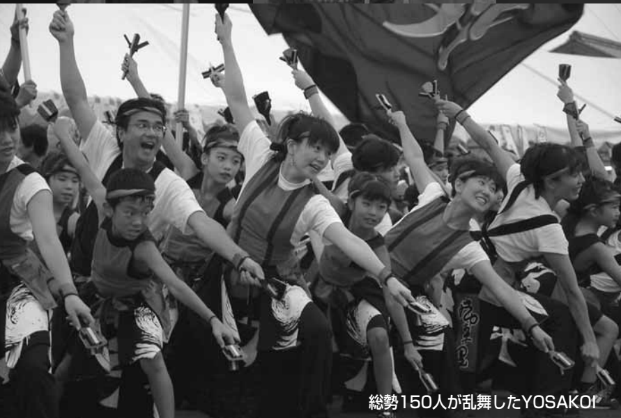
総勢150人が乱舞したYOSAKOI