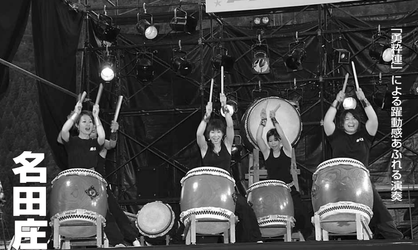
「勇粋連」による躍動感あふれる演奏