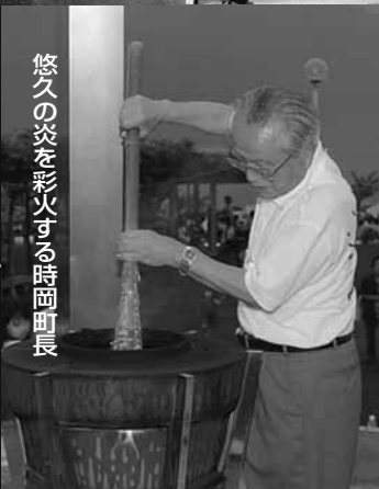
悠久の炎を彩火する時間町長