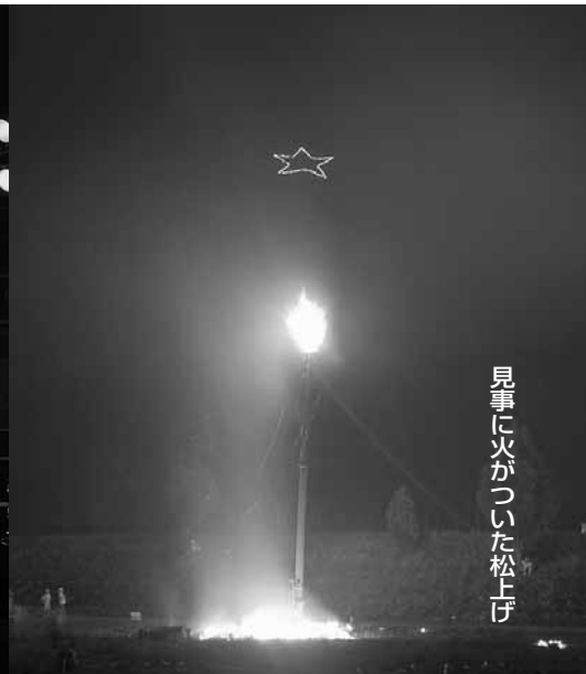
見事に火がついた松上げ