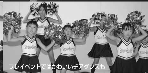
ブレイVENTではかわいいチアダンスも