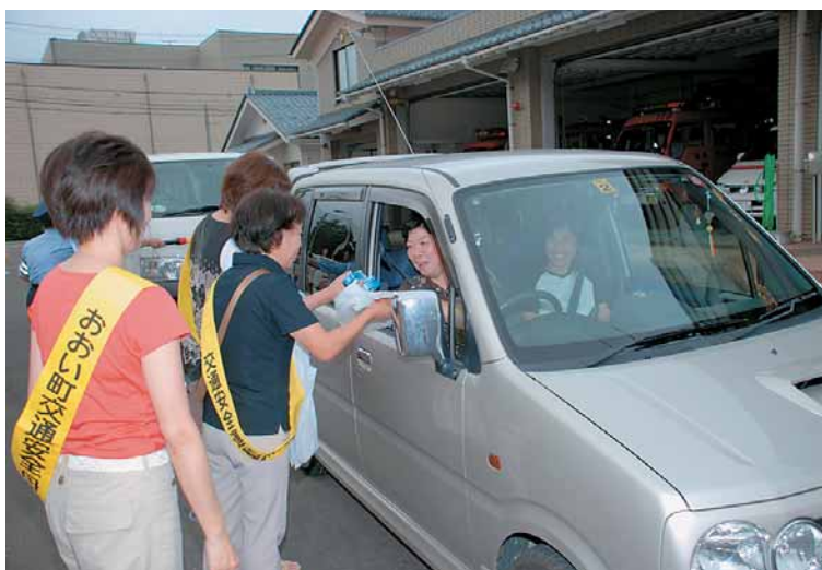
立ち寄ったドライバーに安全運転を呼びかけた