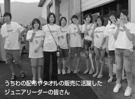
うちの配布やタオルの販売に活躍した ジュニアリーダーの皆さん