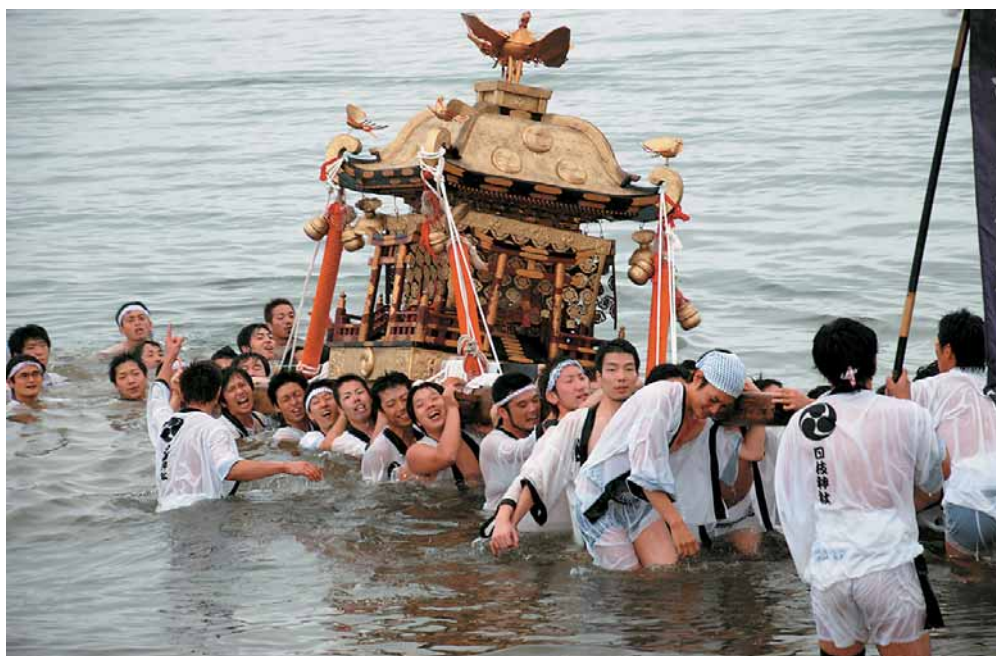
水中で豪快に神輿を担ぐ青年義団