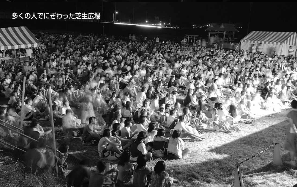
多くの人でにぎわった芝生広場