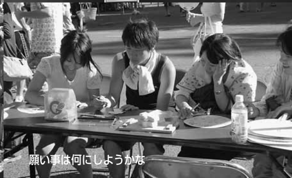
願い事はなにしようかな