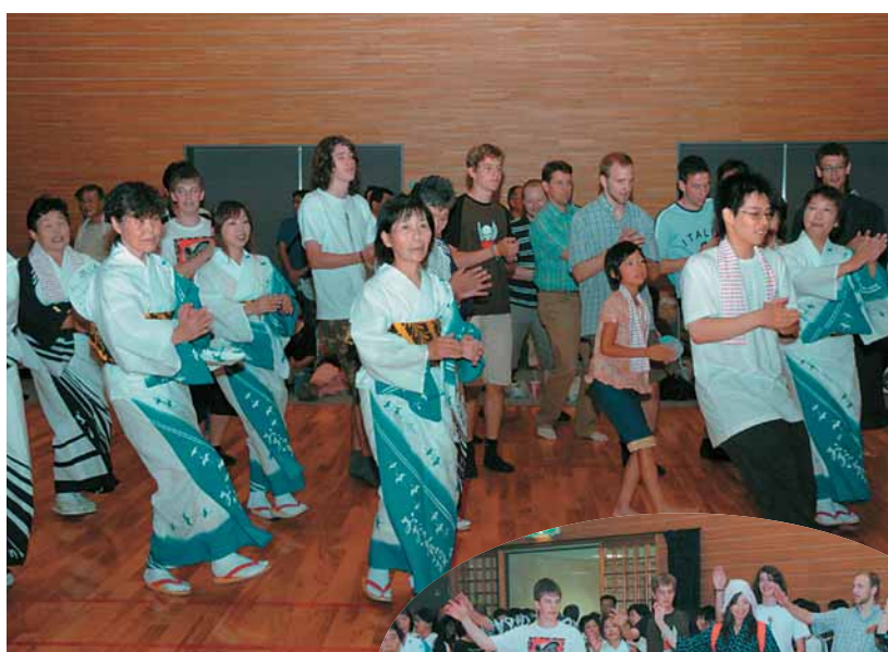
みんなで輪になって踊りを楽しんだ