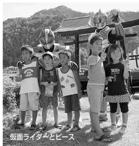
仮面ライダーとピース

芝生広場のステージでは「爆笑！よしもとスーパーライブ」が行われ、テレビでもおなじみの人気漫才コンビが登場。たくさんのお客をドツと沸かせた。また、キャラクターショーや町内のバンドグループの演奏も行われた。ステージの周辺では、フリーマーケットや子ども広場などのイベントも行われ、元気な声が響いていた。