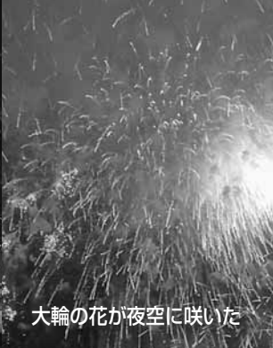
大輪の花が夜空に咲いた