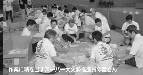
作業に精を出すスーパー大火勢推進員の皆さん