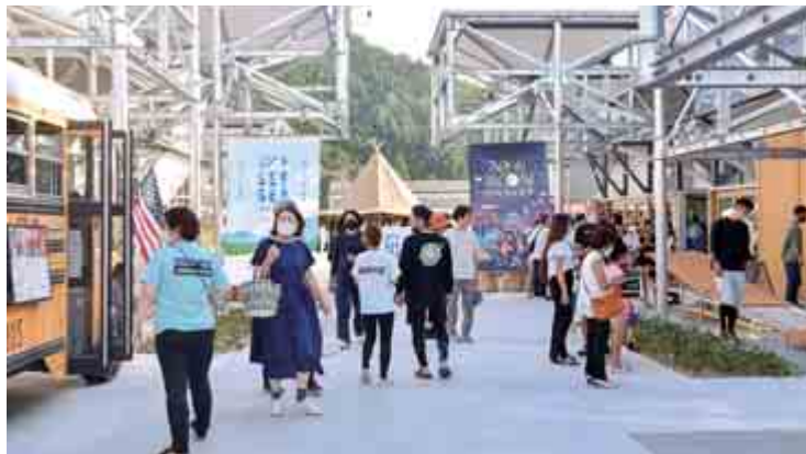
【SEE SEA STREET】

夜になるとSEE SEA PARKはまた違った一面を見せます。外壁となっているETFE等から施設内の光が自然にしみ出し、夜のうみんぴあエリアに明かりを灯します。今後は夜の時間帯のイベントも行う予定です。ぜひ夜のSEE SEA PARKにもご期待ください。