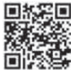
参加申し込みフォーム