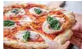
【窯で焼いたピザが食べられます!】