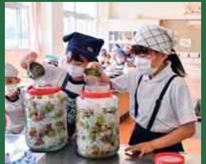
※ コロナ感染対策、熱中症予防のもと体験学習を行っています。