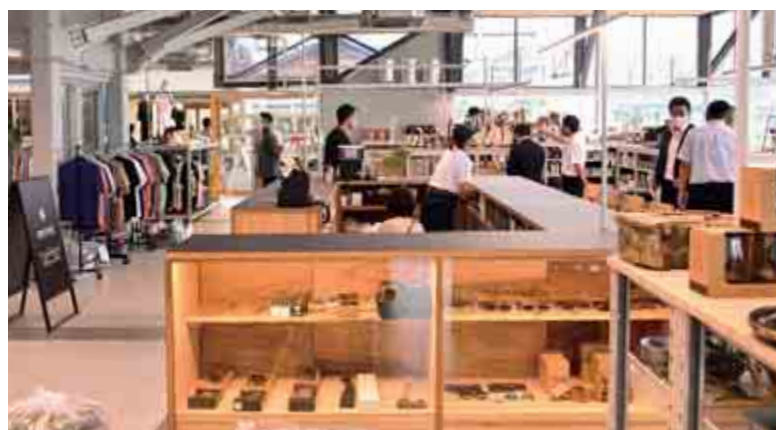
【 THE GATE WAKASA 】

そのほかにもカフェデザイン、グヤファミリーファッション、リラクゼーションのテナントが入居し、おおい町に賑わいをもたらします。