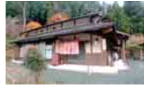
【よざえもんc a f e】