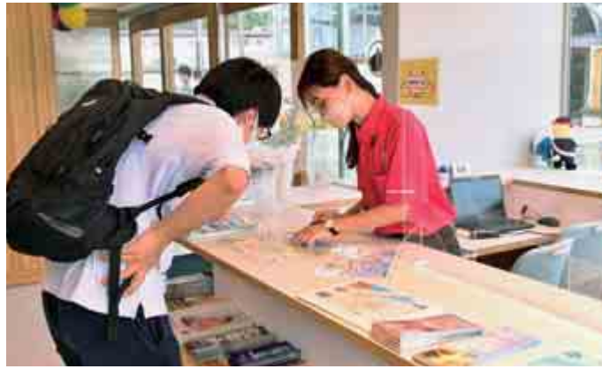
【若狭おい観光案内所】

観光の拠点とするとともに、商工観光に関わる行政手続きをワンストップで行える体制を整えています。