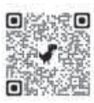
おおい町ホームページ 介護保険料 減免について