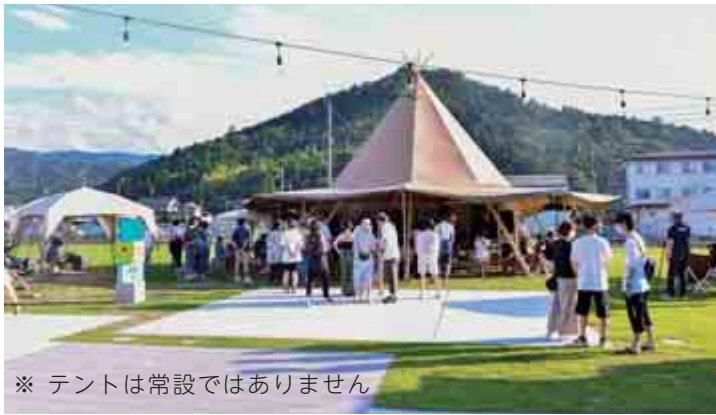
※ テントは常設ではありません

は南側に広がる芝生広場です。大きさは約2000平方メートルで、ピクニックやペットとの