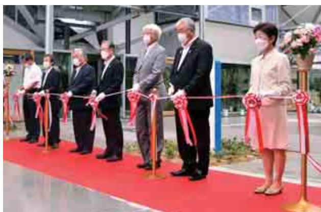
【テープカットで完成をお祝い】