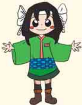
本郷小学校制作 マスコットキャラクターうめりちゃん

他にも本郷小学校では、児童たちがおい町の特産品や、豊かな自然を題材としたマスコットキャラクターを作成するなど、ふるさとに対する愛情を育む取り組みを行っています。