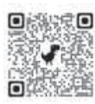
おおい町ホームページ 後期高齢者医療保険料 減免について