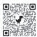
原子力規制委員会 実務経験者採用情報