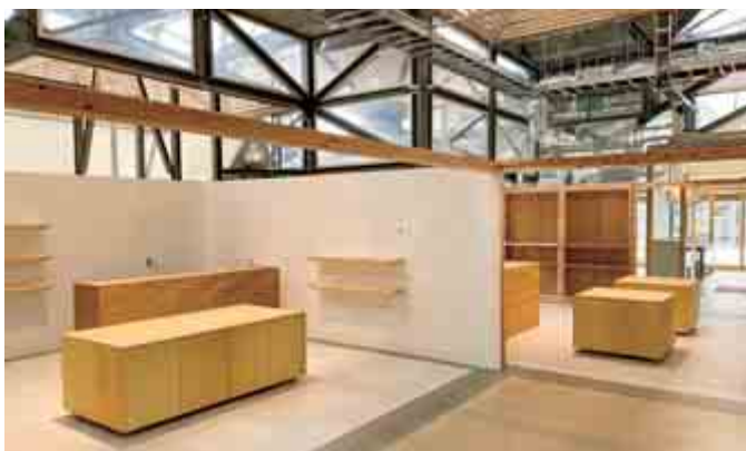
チャレンジ区画 出店されるチャレンジャーを応援してください

施設内には椅子や机といった様々なインテリアを設置します。写真はその一部ですが、SEE SEA PARKの雰囲気に合わせ家具の色は白や青、グレーをベースにしたり、材質には木材を使ったものを多く取り入れています。