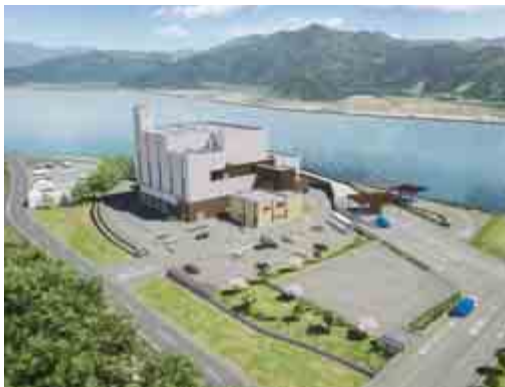
▲ 広域ごみ処理施設(イメージ)