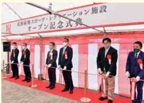
【 式典の様子 】

4 月9日に成海緑地スポーツ・レクリエーション施設のオープンを記念し、式典が執り行われました。