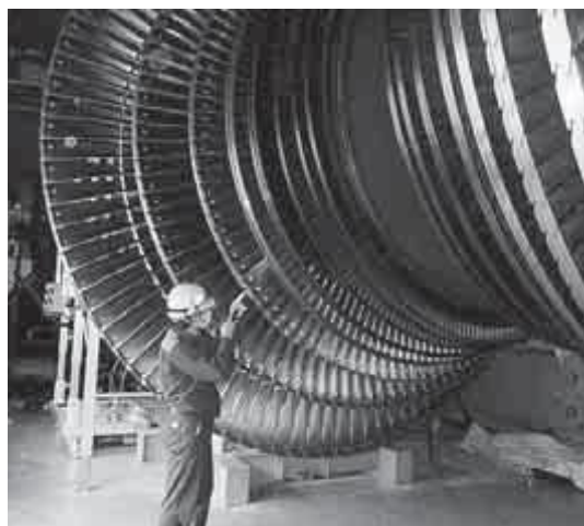
【 検査の様子 】