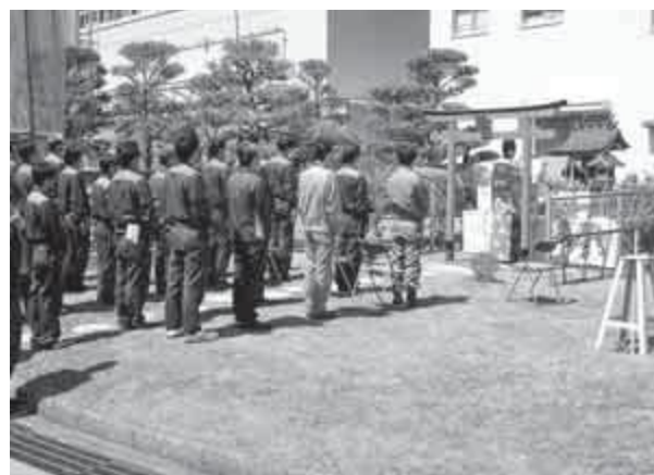
【 安全祈願の様子 】