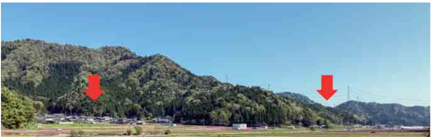
【写真左側に岡安集落 右側に岡安遺跡】

実際に塩づくりに関わる地域は、間違いなく海岸部でしょう。ですが、その背景には海水を煮つめる器（いわゆる土器）や、薪炭などを準備する人たちの存在も考えなければなりません。そして、ある程度の成果品を集める集積場（こぢうら）は、第一義的には郡衙としての※ 16 小堀が考えられますが、9世紀以降のことだと思われま（す）も確保する必要があります。岡安は、式内社である依居神社