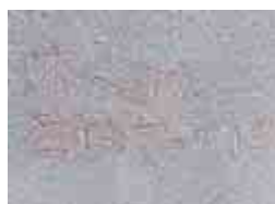
【 オハヨウ学校ファイト!! 】

(※S) これは佐分利小学校のある在校生が入学式前日通学路に作ったものだからです▼摘み取ったつくしを用いて文字が作られています▼入学式へと向かう、緊張した新入生に向けた先輩からのメッセージなのだから▼そんな心温まるお話でした▼