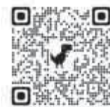
おい町 ホームページ 児童手当制度について

毎月6月に提出していた現況届が原則不要になります。ただし、一部受給者については引き続き現況届の提出が必要です。必要な人にのみ町から提出案内を送付します。