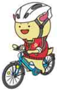
福井県マスコットキャラクター はびりゅう