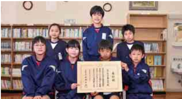
日頃の積極的な読書活動や読書推進の取組などが評価され、本郷小学校が「令和4年度子供の読書活動優秀実践校」に福井県内の小学校で唯一選ばれました。 (4月28日 本郷小学校)