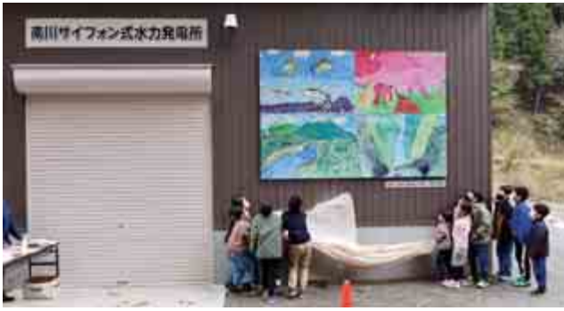
南川サイフォン式水力発電所の見学会が行われました。見学会では名田庄小学校の児童が想いを込めて描いた壁画の除幕式が執り行われました。 (4月18日 名田庄納田終南川)