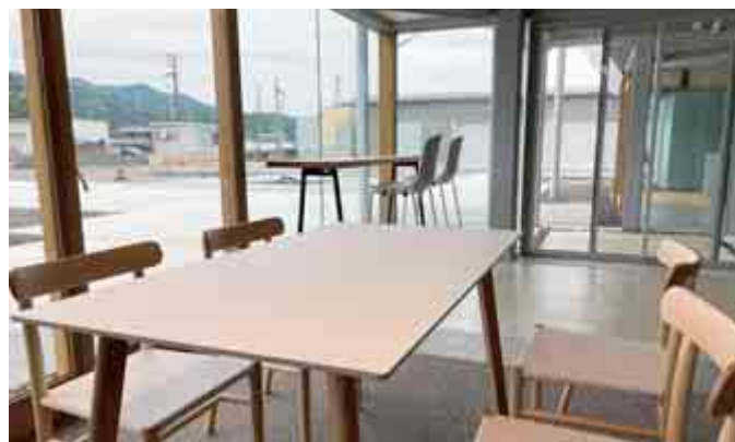
雰囲気に合わせた家具を設置