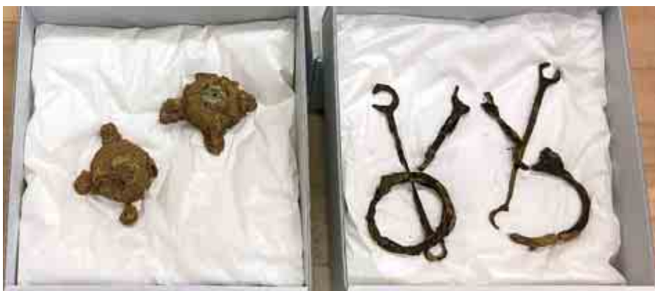
【鹿野古墳出土の馬具】 おおい町立郷土史料館蔵

う。江戸時代くらいまでは、舟で石山あたりまで行き来が可能だったという記述が『大飯町誌』にあることから、河川という有用な流通路を確保してその起点をおさえるということとは、大きな利点だったと考えられます。また、もうひとつの要点として、福谷峠と石山峠（最近まで、石