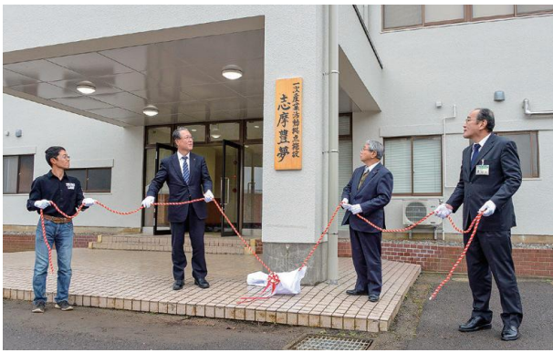
一次産業に興味のある方が、おい町において農業・林業・漁業などを体験または研修していただく際の活動拠点となる滞在施設『志摩豊夢』が整備されました。(12月20日 大島地区)