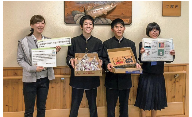
赤ちゃんふれあい体験学習のお礼として、名田庄中学校1年生から「赤ちゃんやお母さん方に。」と、絵本リストや積み木、アロマキャンドルをいただきました。(12月21日 あっとお〜むいきいき館)