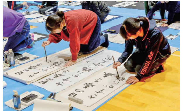
おい町書道連盟主催による第29回新年書初め大会が行われました。参加者は、真剣な表情で課題に取り組みました。(1月5日 あみーシャン大飯)