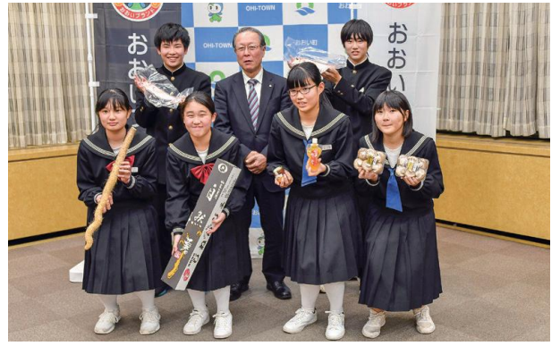
おい町ブランドレシピコンテストの授賞式が行われました。おい町の特産品をより美味しく食べられるように工夫されたレシピを考えてくれた中学生6名が受賞しました。(12月12日 おおい町役場)