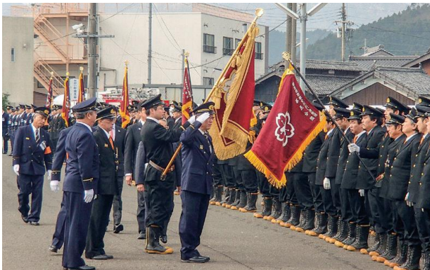
おい消防団出初式が行われました。式では、左分利川に向かって放水・観閲式の後、町民センターまで分団ごとに力強く整然と行進しました。(1月8日 左分利川河川敷他)