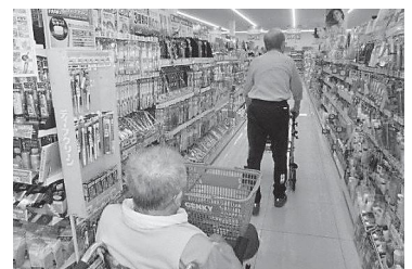
▲ 車椅子、ウォーカーで店内散策