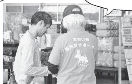
認知症サポーターの街頭啓発