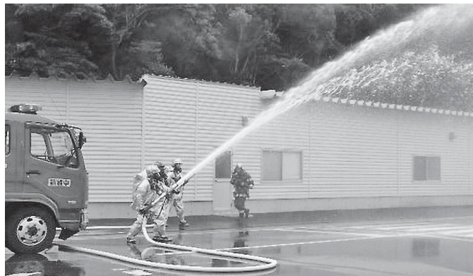
【自衛消防隊による消火活動の様子】

訓練では、発電所の自衛消防隊と若狭消防組合の隊員ら計約 100 人が参加し、両消防隊の連携や迅速かつ的確な消防活動について確認しました。