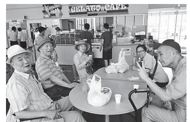
▲ 買い物後、道の駅にて団らん

おい町保健・医療・福祉総合施設 通所リハビリテーション 〒919-2111 福井県大飯郡おい町本郷 92-51-1 TEL.0770-77-1050