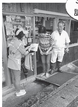
SOS ネットワーク声かけ訓練の模擬徘徊高齢者役