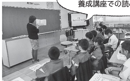
小学校での認知症サポーター養成講座での読み聞かせ