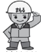
安全まもるくん (大飯発電所キャラクター)