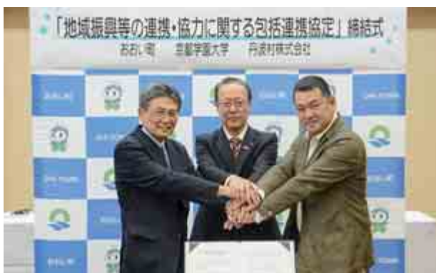
町は、産学官連携による地域振興を目指すため、京都学園大学、農業生産法人丹波村株式会社と包括連携協定を結びました。(11月30日 おおい町役場)