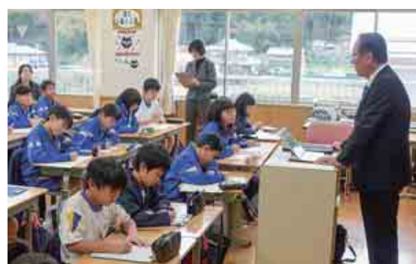
佐分利小学校において、町長出前授業が開かれました。児童らは、これまで学習してきたことを基に、町に対する意見を発表しました。（11月24日 佐分利小学校）