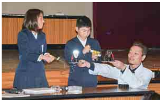
町内の小学校5年生を対象に電気教室が開かれ、児童らは実験を通してエネルギーの必要性や発電の仕組みを学びました。(11月22日 総合町民センター)