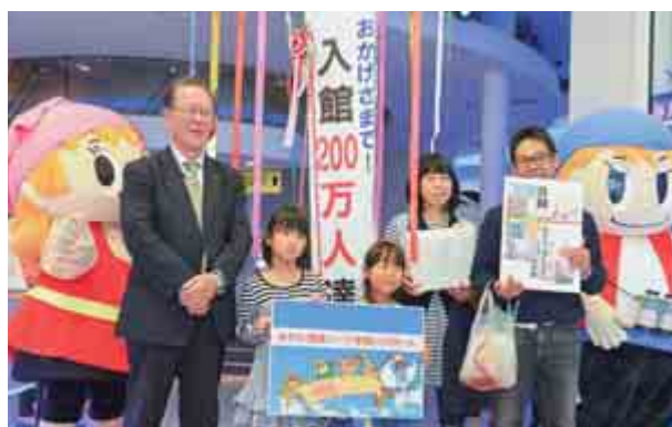
こども家族館がオープンしてから8年、来館者数200万人を突破し、記念式典が開かれました。(11月20日 こども家族館)