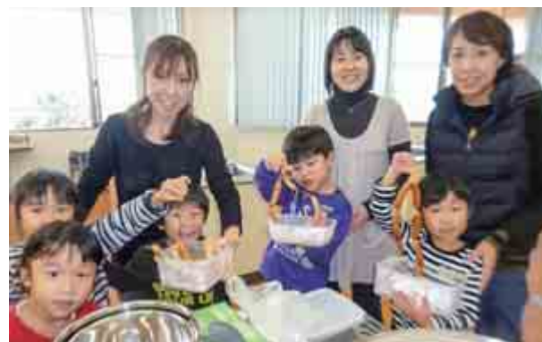
アウトドア教室が開かれ、手作りウィナーの体験を行いました。参加者らは出来上がったウィナーに歓声をあげていました。(12月3日 はまかぜ交流センター)