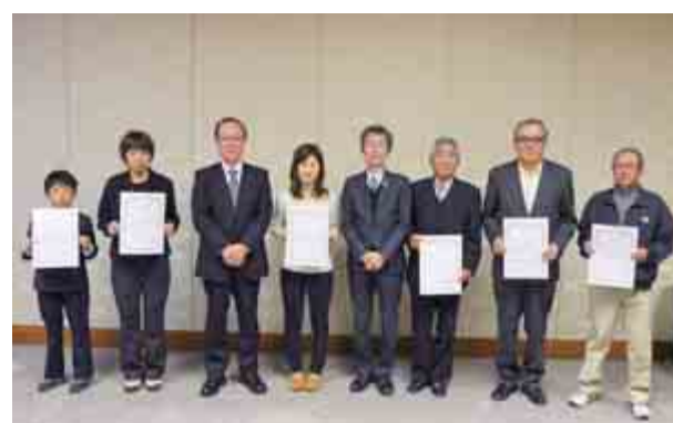
健康づくり標語表彰式が行われました。なお、受賞者及び受賞作品については、13ページで紹介しています。（11月29日 おおい町役場）