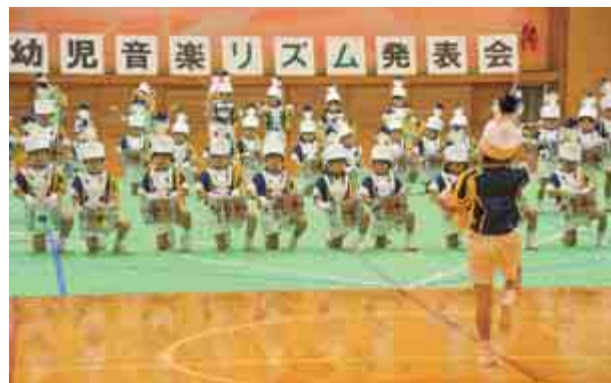
本郷こども園の園児による幼児音楽リズム発表会が行われ、緊張しながらも練習してきた成果を披露しました。(12月4日 総合運動公園体育館)