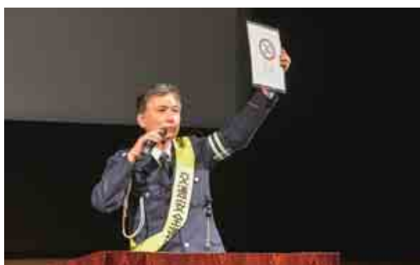
町民を対象とした運転者講習会が行われ、交通事故防止を呼びかけました。(10月24日 里山文化交流センター、25日 総合町民センター)