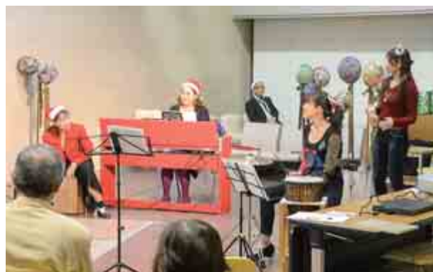
大飯図書館にて、クリスマスジャズコンサートが開かれました。絵本の朗読、歌やピアノ演奏が披露され、会場は大いに盛り上がりました。（12月4日 大飯図書館）