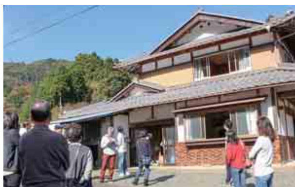
NPO 法人ふるさと福井サポートセンターおおい支部が主催する空き家見学ツアーが開かれ、参加者らは町内の空き家を見学しました。（11月13日 町内）