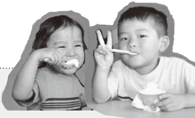
(舞鶴市から お越しの兄弟)

こども家族館によく遊びに来るので、近くに休憩できる場所ができてよかったです。 ジェラートは色々な種類があつて選べるのが嬉しいです。