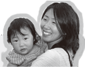
(舞鶴市から お越しの親子)

きれいでオシャレな内館と地元産の新鮮な魚介類や農産物、スイーツ、工芸品など多様な品々が並んでいて、見るだけでも楽しめます。