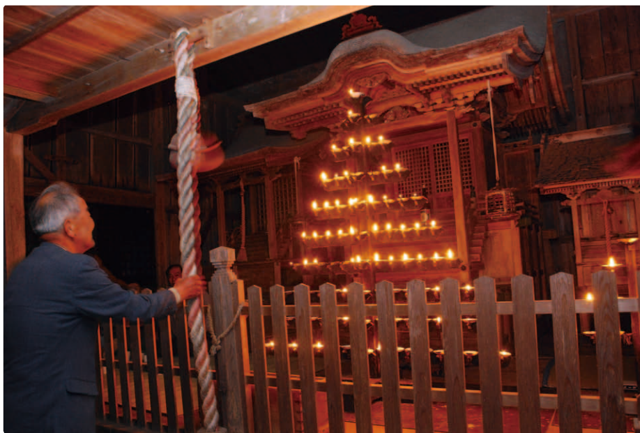
△御百灯の様子 (平成25年5月25日)