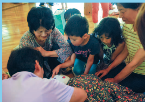
「5歳児世代間交流保育 かかしづくり体験」 (名田庄保育園 6月13日)