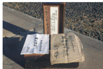
岡田区の御灯明箱