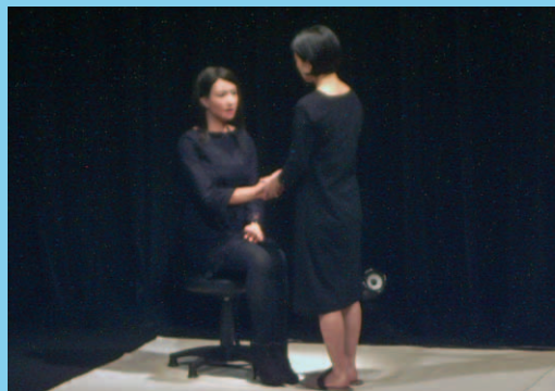
「アンドロイド劇場『さようなら』 (里山文化交流センター 6月2日)