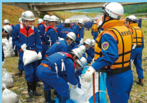
「水防訓練」 (南川河川敷 小倉橋周辺 6月9日)