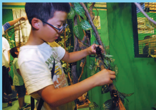
「こども家族館春季企画展 カブト・クワガタムシムシ大行進!!」 (こども家族館 6月8・9日)