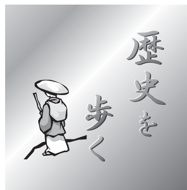
おおい町文化財巡り～その25～