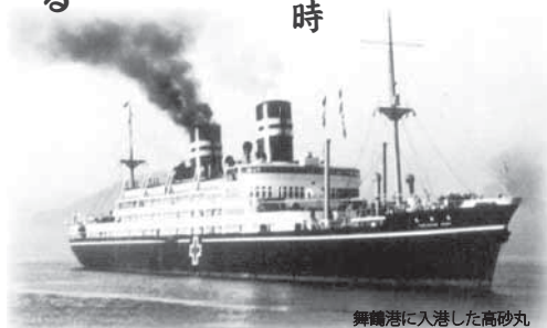
舞鶴港に入港した高砂丸