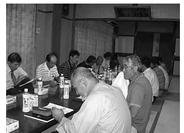
熱心な話し合いが続きました。

現在、坂本子ども会は7名。ラジオ体操、かるた大会の読み手やしめ縄づくり等に老人会の協力を得て行っており、地域での子育て体制ができています。