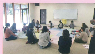
親子でふれあい遊び(すくすく広場)