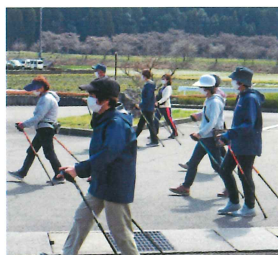
ノルディックウォーキング教室の様子