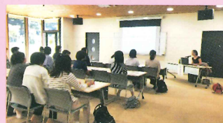
子育て世代向けの講演会も行っています